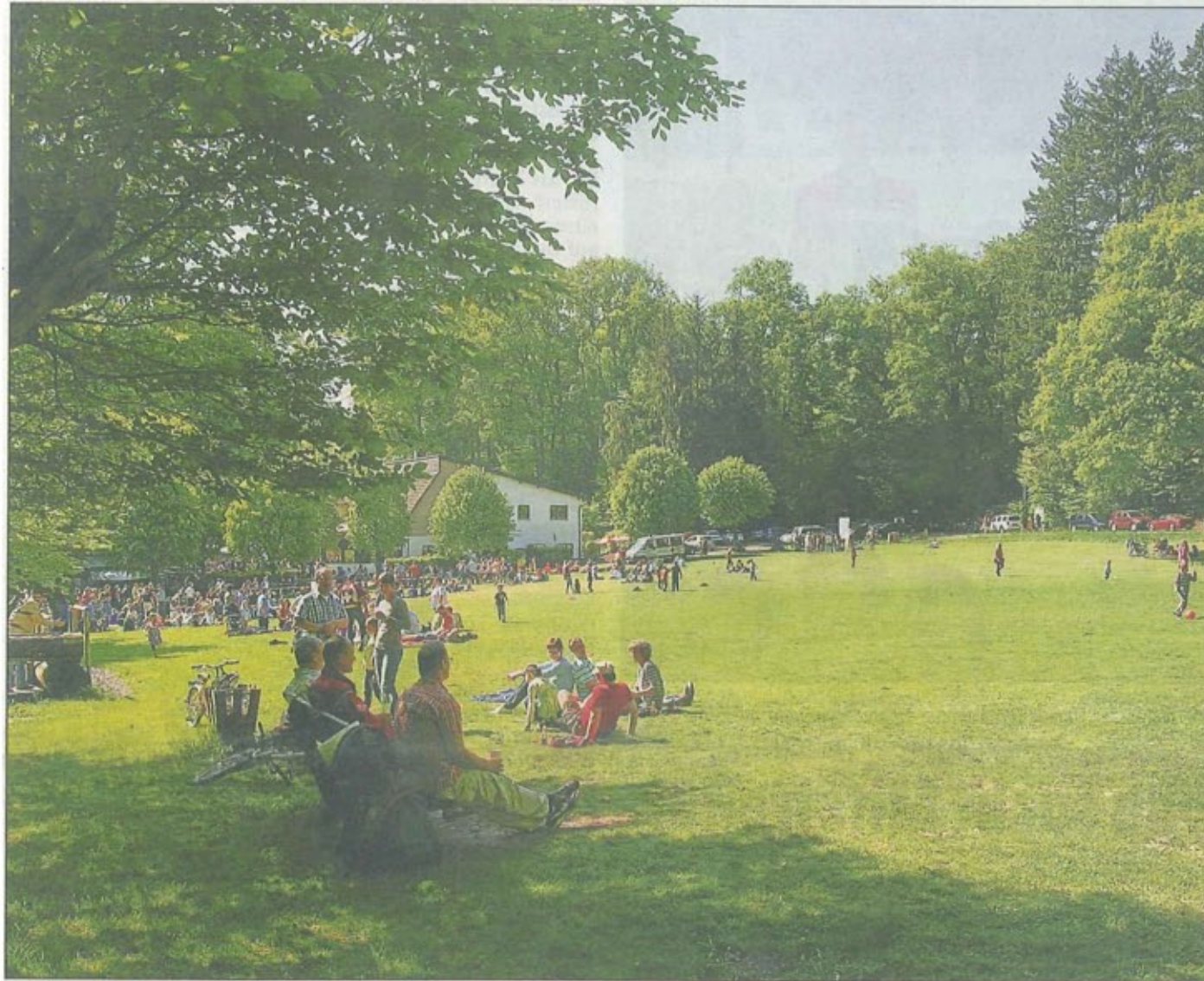
Heute um 10 Uhr beginnen auf der Wiese am Acis die Veranstaltungen zum Tag des Waldes.